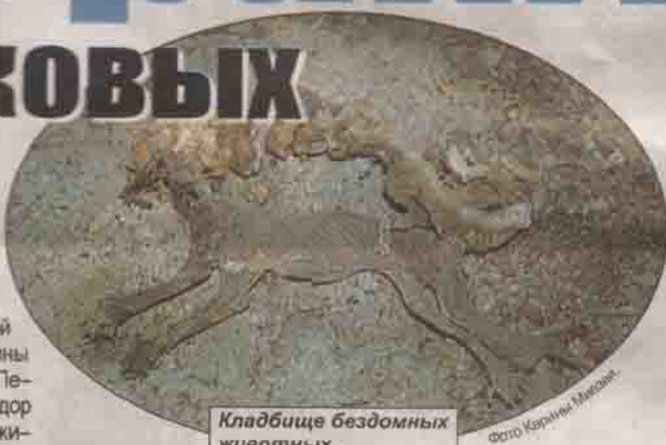
Кладбище бездомных животных.